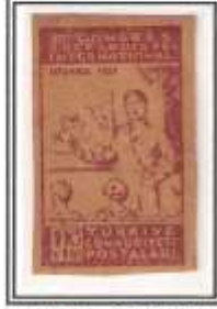
1) mor - kirli baskı kalın kağıt