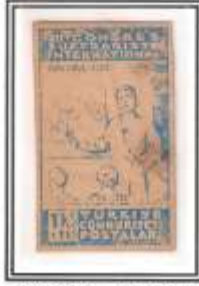
19) mavi - orta kağıt