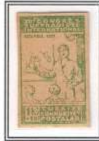
12) siyah - kirli baskı orta kağıt