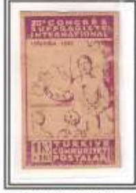
2) mor - zamklı ince kağıt