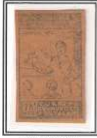
18) açık mavi ince kağıt