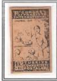
9) yeşil - kalın kağıt