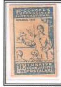
20) koyu mavi kalın kağıt

XII e CONGRESS SUFFRAGISTE INTERNATIONAL