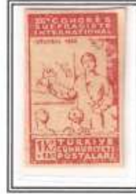
6) açık kırmızı kalın kağıt