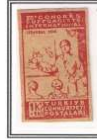
7) kırmızı - kirli baskı kalın kağıt