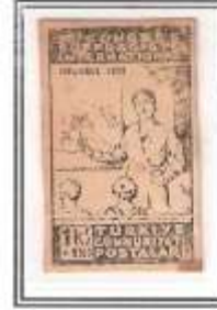
10) açık yeşil ince kağıt