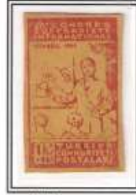
17) kırmızı,sarı kalın kağıt