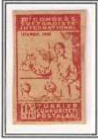
4) kırmızı - orta kağıt