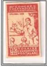
14) beyaz,kırmızı kalın kağıt