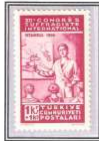
Serinin tedavüle verilmiş 1 kr.+1 kr. değerindeki pulu

Bu denemelerden otuz adedin üzerinde takım olduğu sanılmaktadır.Hepsi 2012 ve 2013 yıllarında ortaya çıkmıştır ve sahtelerdir.Muhtemelen Türkiye'de üretilmişlerdir.Denemeler föylere albüm içindeki sırasına göre konmuştur.