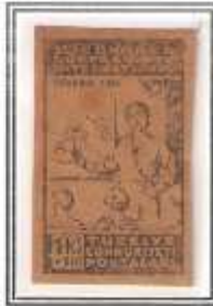
8) koyu yeşil kalın kağıt