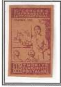
16) mor - ince kağıt