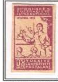
3) mor - net baskı kalın kağıt