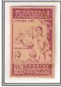
15) mor - orta kağıt