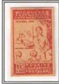
5) koyu kırmızı kalın kağıt