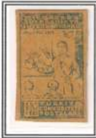
11) siyah - kirli baskı zamklı - orta kağıt