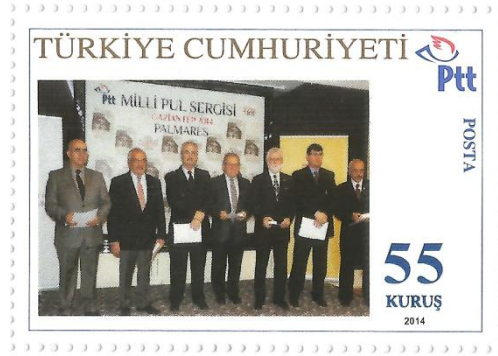
Jüriler toplu halde

Palmares (Ödül töreni) The Anatolian Oteli Lidya salonunda yapılmıştır. Törene PTT ve Gaziantep ili protokolü katılmış; Koleksiyonerler de yoğun ilgi göstermiştir. Törende Jüri değerlendirmesine göre diplomalar ve madalyalar ile büyük ve özel ödüller sahiplerine verilmiştir.