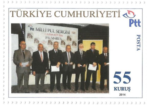
Jüriler toplu halde

Palmares (Ödül töreni) The Anatolian Oteli Lidya salonunda yapılmıştır. Törene PTT ve Gaziantep ili protokolü katılmış; Koleksiyonerler de yoğun ilgi göstermiştir. Törende Jüri değerlendirmesine göre diplomalar ve madalyalar ile büyük ve özel ödüller sahiplerine verilmiştir.